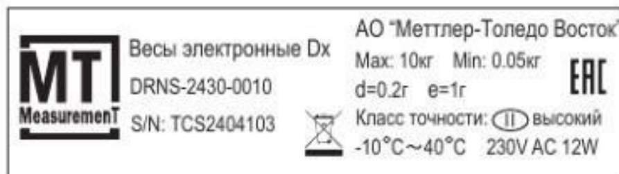
Рисунок 5 – Пример маркировочной таблички

Серийный номер в буквенно-цифровом формате и знак утверждения типа наносится на маркировочную табличку, которая наклеивается на раму под грузоприемную крышку или сбоку на раму весов, как показано на рисунках 6 и 7.