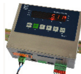
Весовой терминал ID511