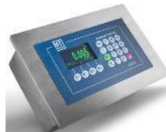
Весовой терминал ID510