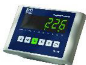
Рисунок 2 – Общий вид ГПУ весов