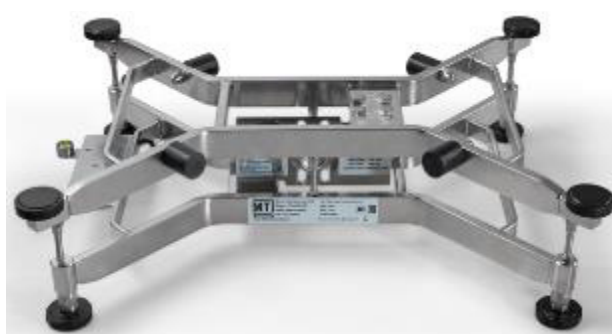
Рисунок 6 – Место нанесение маркировочной таблички со знаком утверждения типа и серийным номером на раму весов под грузоприемную крышку

Серийный номер в буквенно-цифровом формате и знак утверждения типа наносится на маркировочную табличку, которая наклеивается на раму под грузоприемную крышку или сбоку на раму весов, как показано на рисунках 6 и 7.