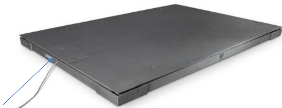
Рисунок 7 – Место нанесения маркировочной таблички со знаком утверждения типа и серийным номером на раму весов

Пломбирование весов осуществляет изготовитель при максимальной нагрузке весов до 300 кг. Весы с максимальной нагрузкой более 300 кг поверяются после пуска наладки на месте эксплуатации аккредитованной на поверку лабораторией, которая принимает весы.