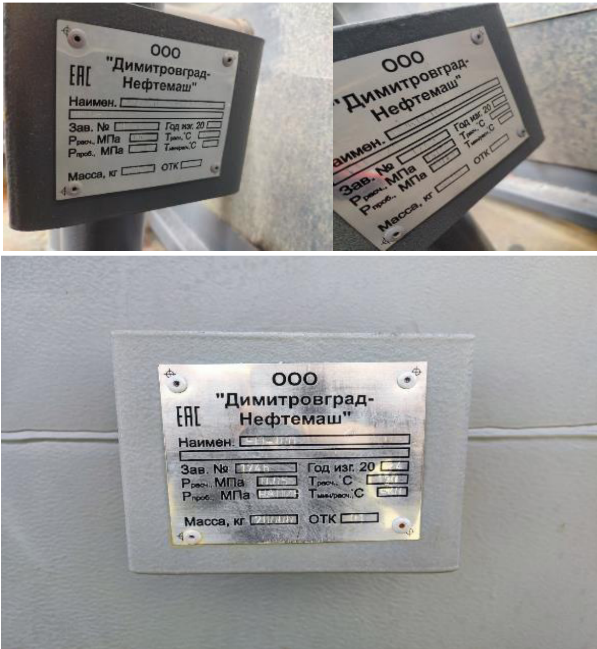
Рисунок 1 – фото табличек с указанием зав. номеров. резервуаров горизонтальных стальных цилиндрических РГСП, модификаций РГСП-25 зав. №№ 1744, 1745 и РГСП-100 зав. № 1746