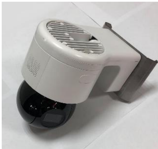
б) обзорная камера