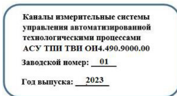
Рисунок 2 – Идентификационная бирка

Наименование, заводской номер в цифровом формате, год выпуска указываются на идентификационной бирке, показанной на рисунке 2.