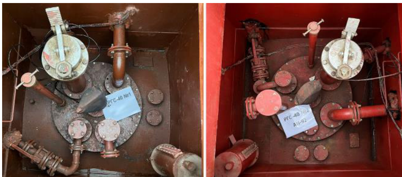
Рисунок 3 – Горловины и измерительные люки резервуаров РГС-40 зав.№№ 1, 2

Пломбирование резервуаров РГС не предусмотрено.