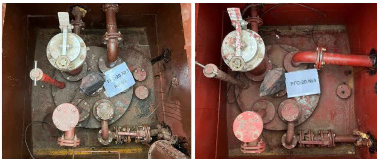
Рисунок 2 – Горловины и измерительные люки резервуаров РГС-20 зав.№№ 3, 4