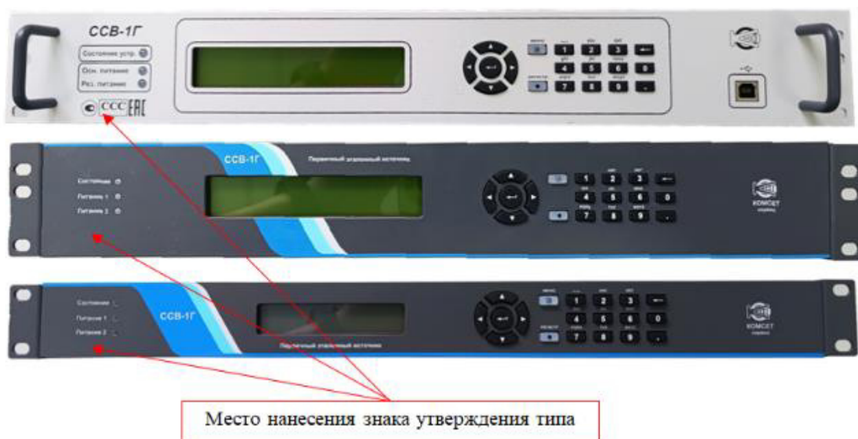
Рисунок 2 – Передняя панель сервера синхронизации времени ПЭИ ССВ-1Г