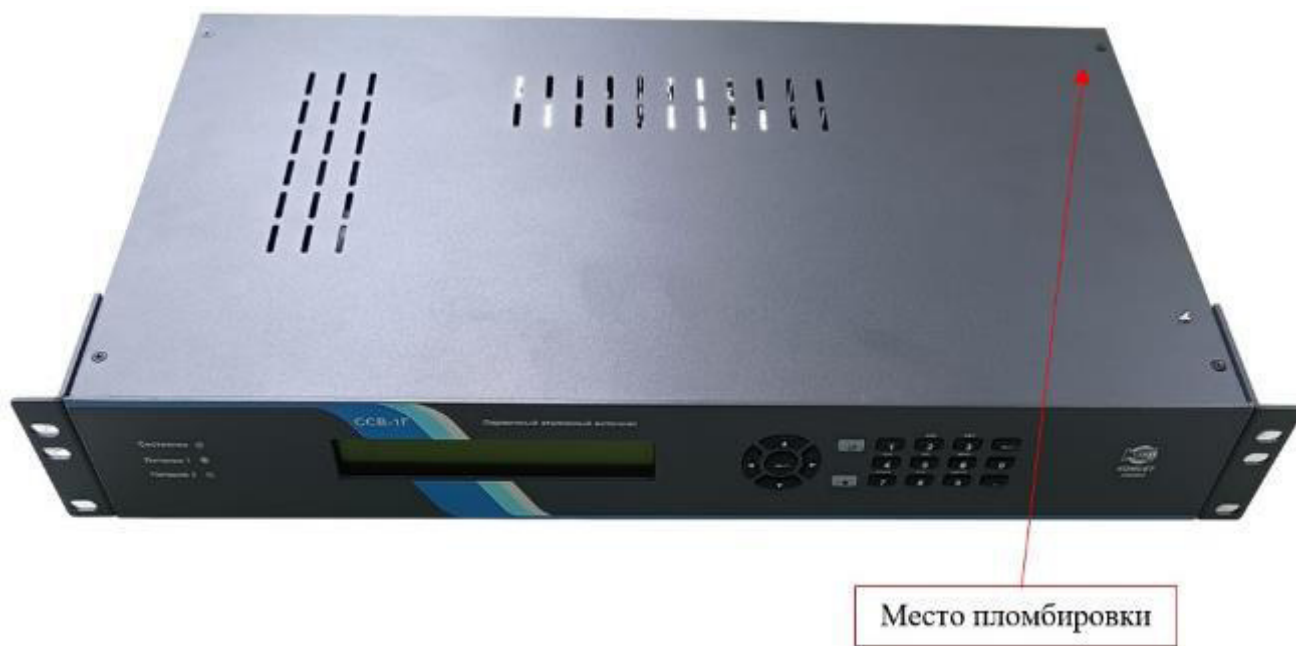
Рисунок 1 – Внешний вид сервера синхронизации времени ПЭИ ССВ-1Г и место пломбирования

Внешний вид ССВ с указанием мест пломбирования и нанесения знака утверждения типа и заводского номера приведен на рисунках 1, 2, 3.