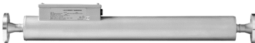
Рисунок 1 – Общий вид датчика плотности

Общий вид датчика плотности приведен на рисунке 1.