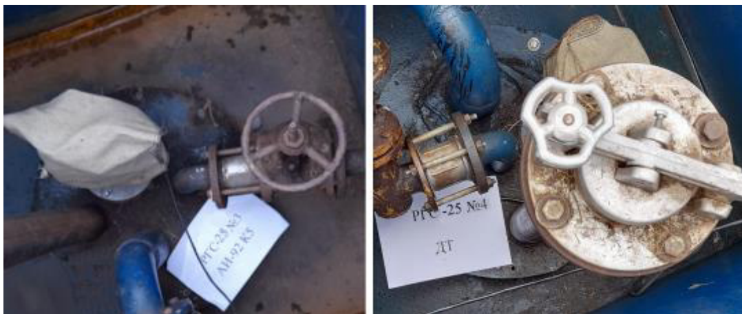
Рисунок 3 – Горловины резервуаров РГС-25 зав.№№ 3, 4