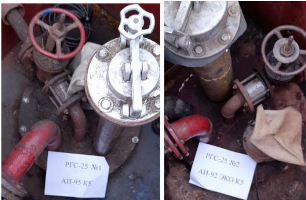
Рисунок 2 – Горловины резервуаров РГС-25 зав.№№ 1, 2