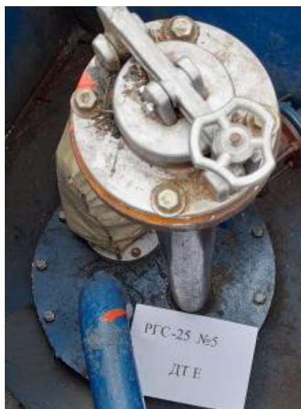
Рисунок 4 – Горловина резервуара РГС-25 зав.№ 5

Пломбирование резервуаров РГС-25 не предусмотрено.