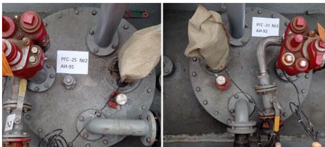
Рисунок 2 – Горловины резервуаров РГС-25 зав.№№ 2, 3