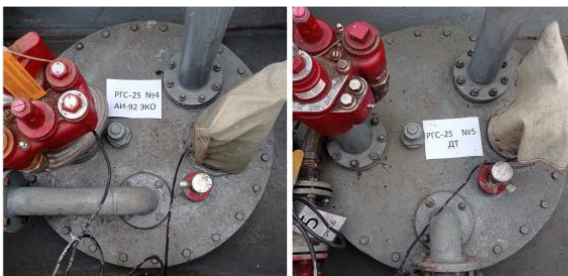
Рисунок 3 – Горловины резервуаров РГС-25 зав.№№ 4, 5