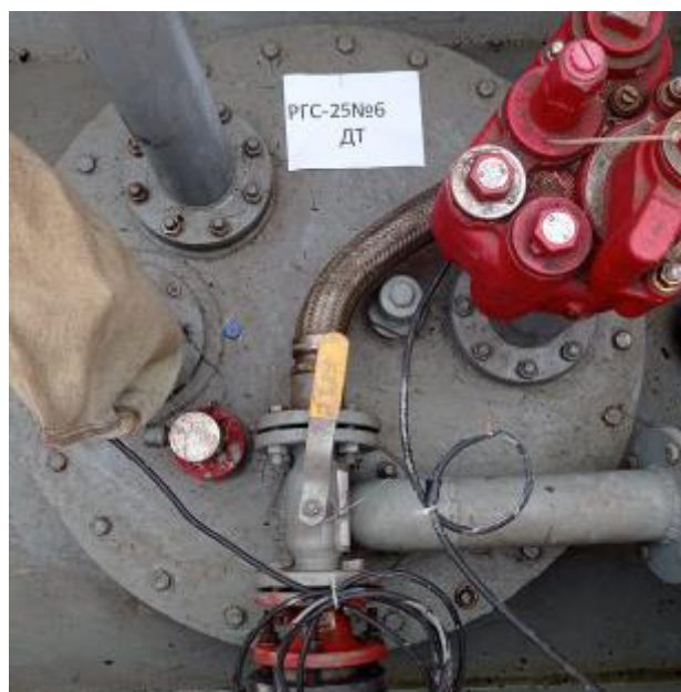
Рисунок 4 – Горловина резервуара РГС-25 зав.№ 6

Пломбирование резервуаров РГС-25 не предусмотрено.