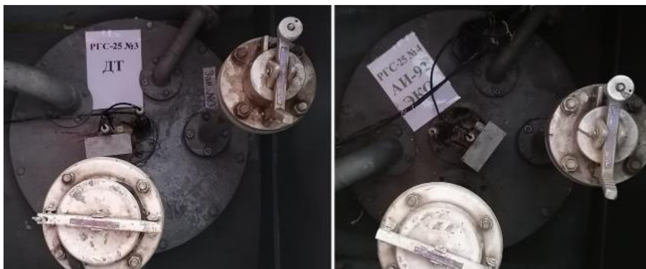
Рисунок 3 – Горловины резервуаров РГС-25 зав.№№ 3, 4

Пломбирование резервуаров РГС-25 не предусмотрено.