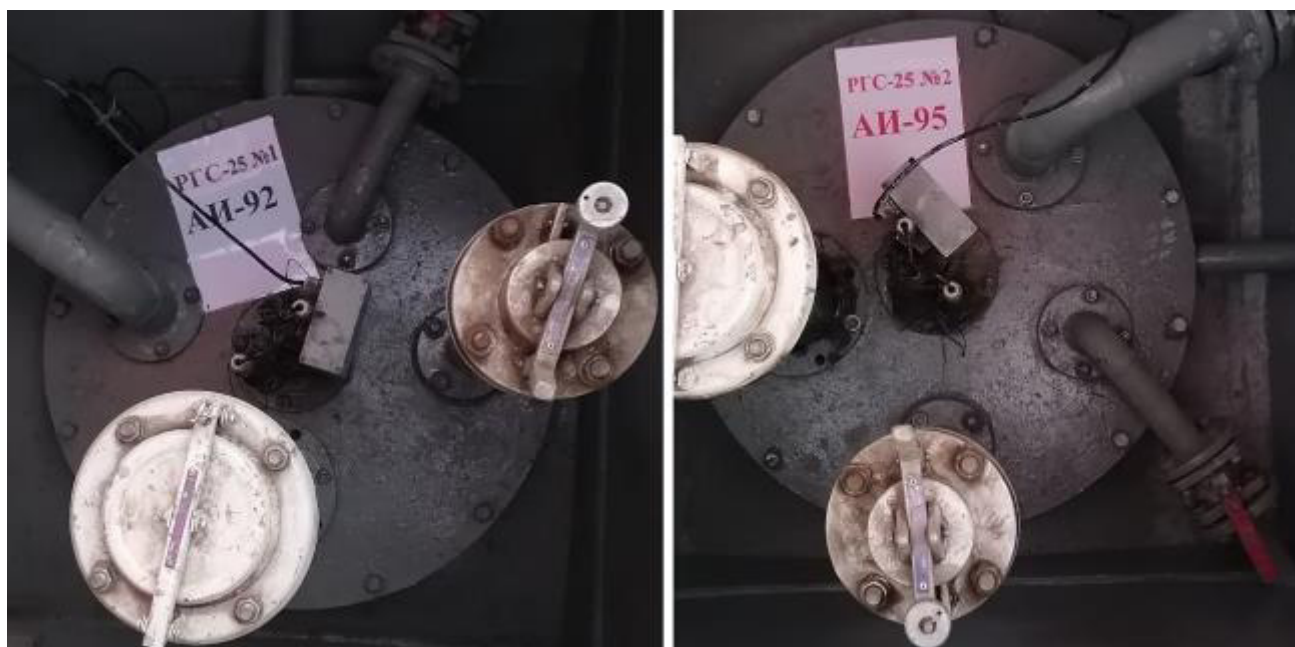
Рисунок 2 – Горловины резервуаров РГС-25 зав.№№ 1, 2