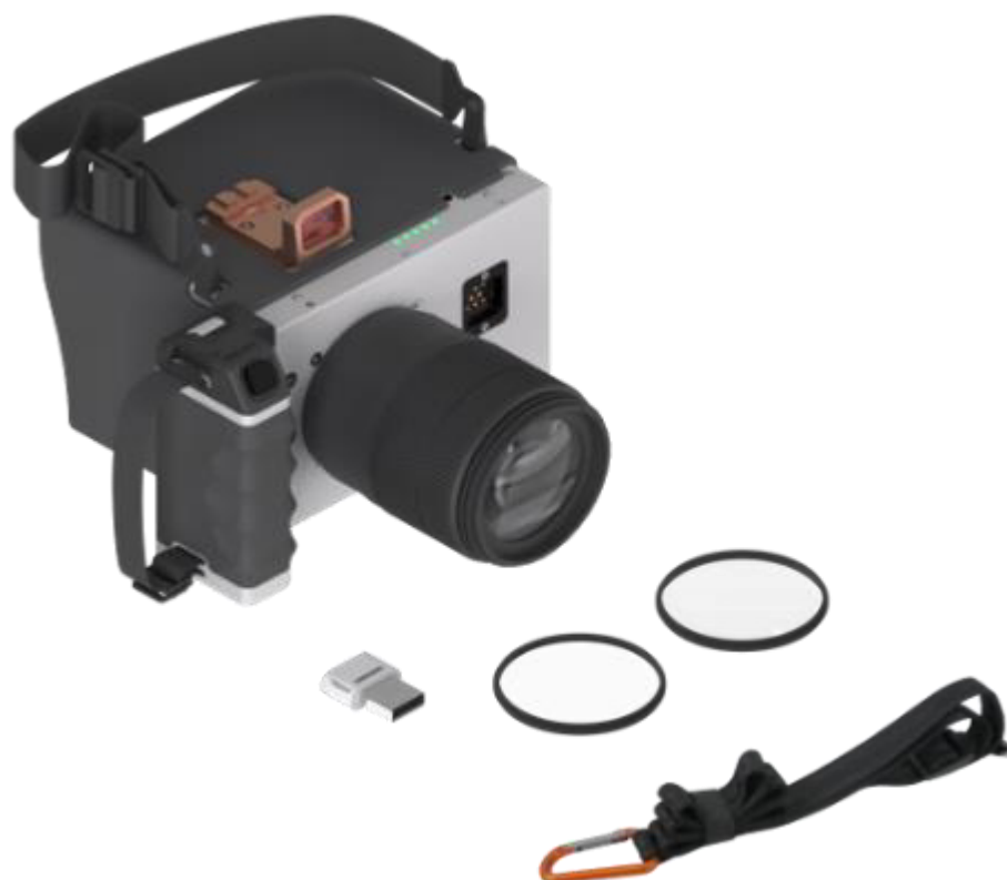
Рисунок 1 – Общий вид фоторегистрирующей камеры