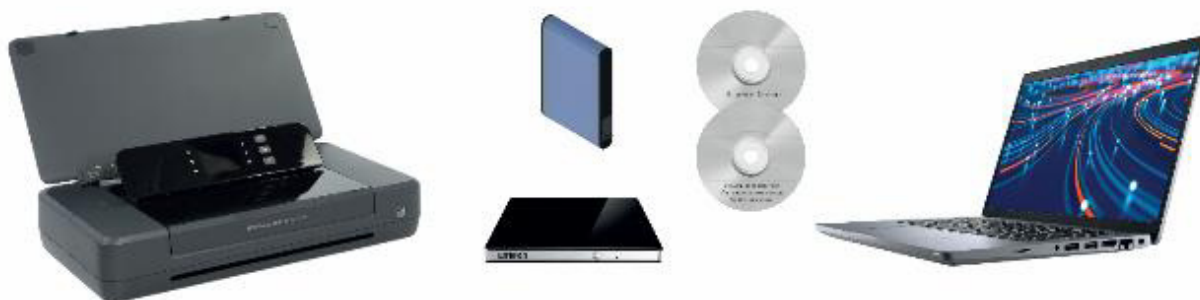
Рисунок 3 – Общий вид РМОИ приведен на рисунке