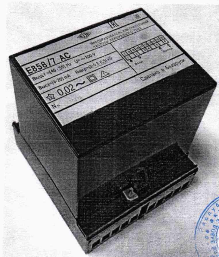
Рисунок 2 – Фотография общего вида ИП Е858