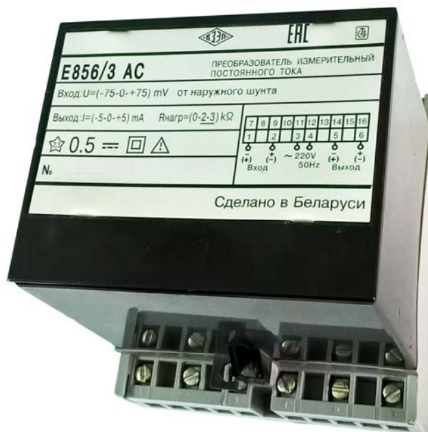
Рисунок 1 - Внешний вид ИП