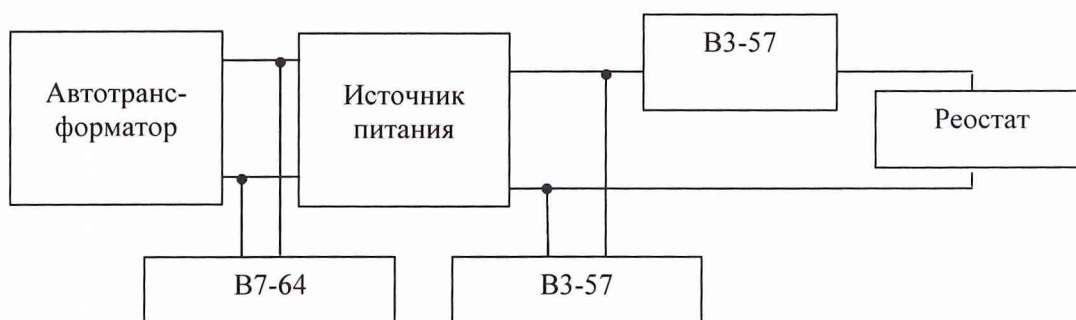
Рис. 3. Структурная схема соединения приборов при определении пульсации выходного напряжения.

Соединить клеммы приборов в соответствии с рис. 3.