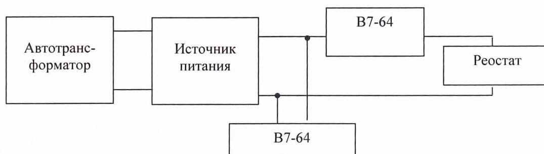
Рис. 2. Структурная схема соединения приборов при определении нестабильности выходного напряжения.

Соединить клеммы приборов в соответствии с рис. 2.