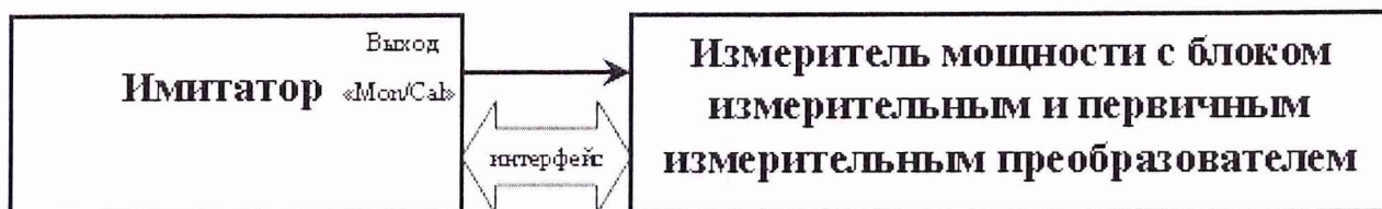
Рисунок 3 – Схема измерений для определения максимального уровня мощности выходных сигналов

8.3.3.1 Собрать схему измерений в соответствии с рисунком 3.