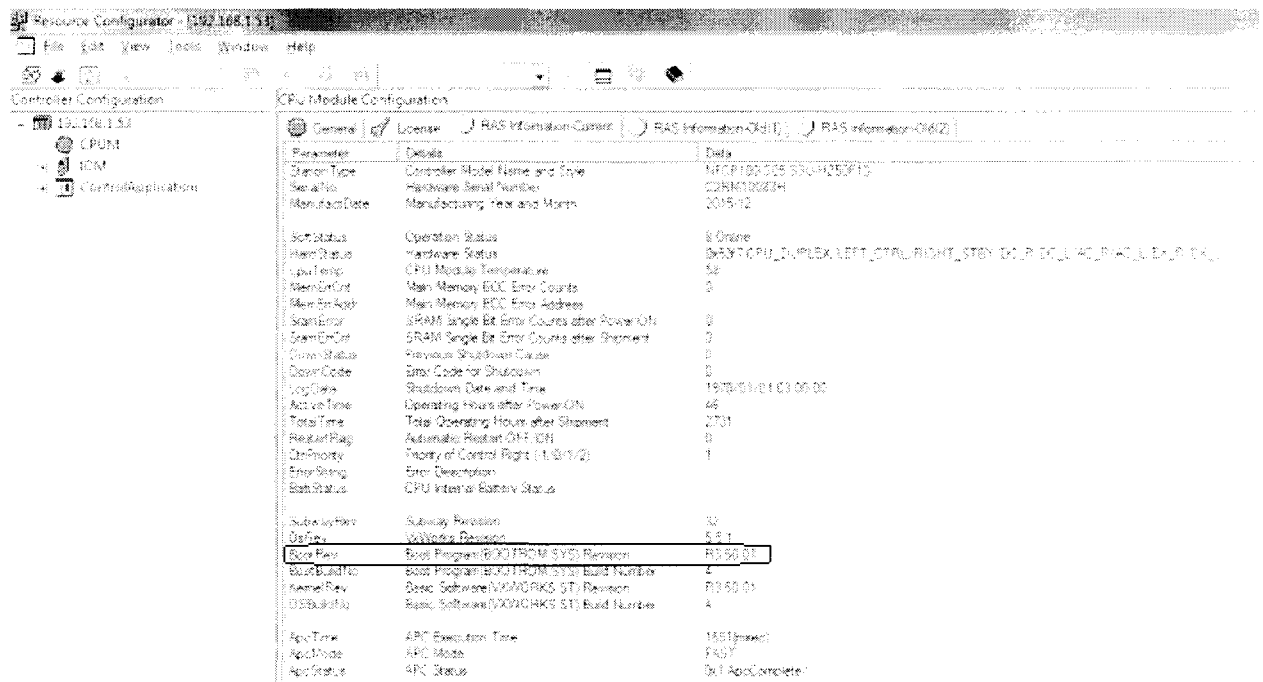
Рисунок 4, номер версии (идентификационный номер) ПО контроллеров.

Для определения номер версии (идентификационный номер) ПО контроллеров необходимо в меню «Пуск» найти программу Resource Configurator. Запустить ее, осуществить подключение к контроллеру, на соответствующих вкладках проконтролировать идентификационные данные ПО – R3.50.01, рисунок 4.