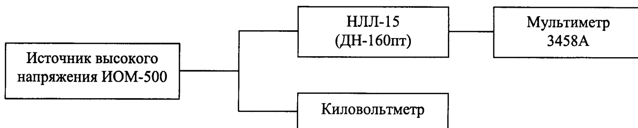
Рисунок 2 – Структурная схема проверки допускаемой основной относительной погрешности измерения напряжения переменного тока

1) собрать схему подключений согласно рисунку 2 и подготовить приборы в соответствии с их руководствами по эксплуатации;