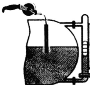
Рисунок 2 – Проверка уровнемера без демонтажа с помощью эталонной рулетки с лотом