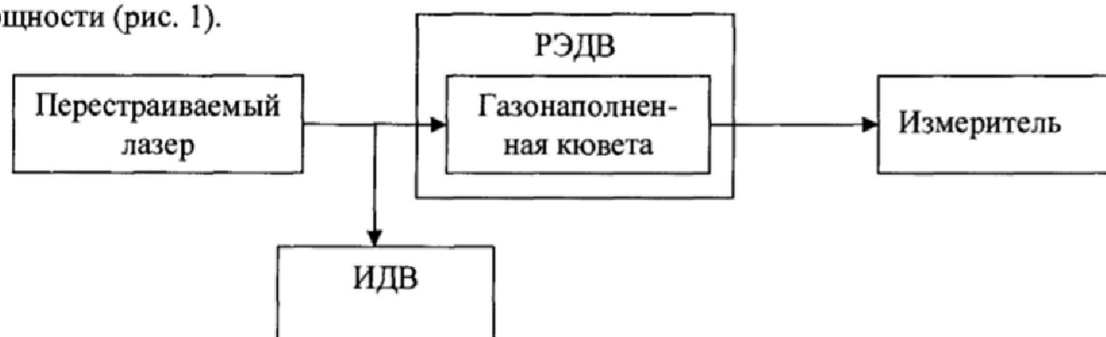
Рисунок 1 - Схема метода калибровки газонаполненных кювет

К разъему «СЛД+кювета», расположенному на передней панели РЭДВ, подключают измеритель оптической мощности из состава Государственного рабочего эталона единицы средней мощности (рис. 1).