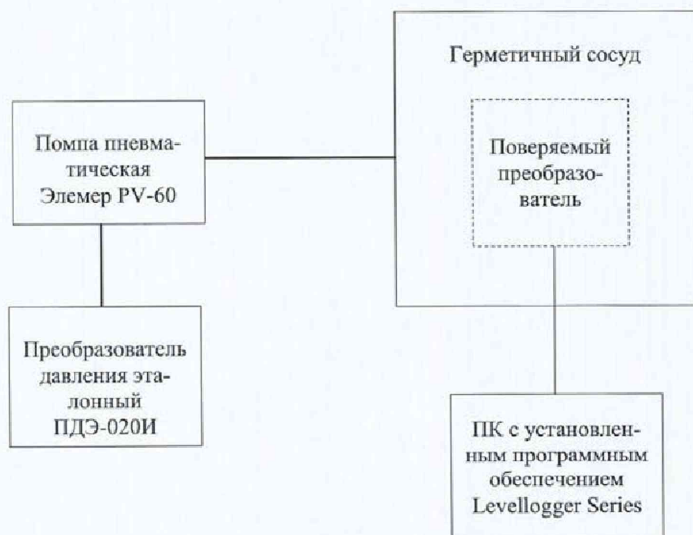
а) Схема определения приведенной (к диапазону измерений) погрешности измерений абсолютного и гидростатического давлений для преобразователей без оптического считывателя USB

4) Считывают измеренные значения давления при помощи преобразователя давления ПДЭ-020И (далее по тексту – ПДЭ) и поверяемого преобразователя.