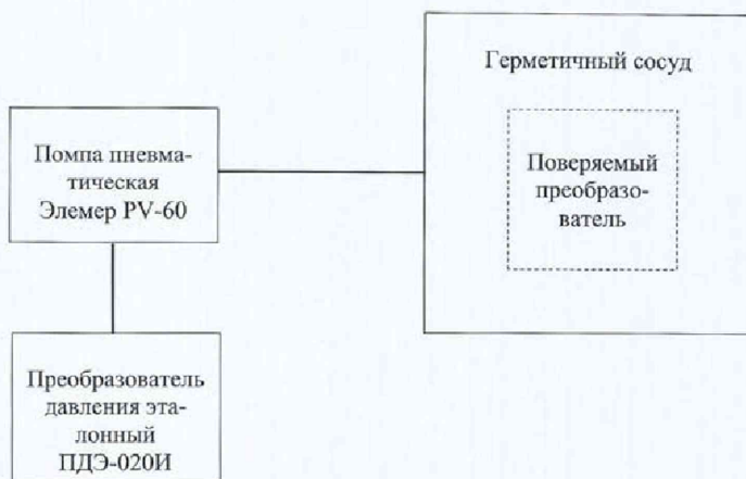
а) Схема определения приведенной (к диапазону измерений) погрешности измерений абсолютного и гидростатического давлений для преобразователей с оптическим считывателем USB