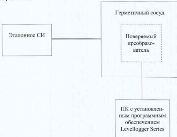
а) Схема определения приведенной (к диапазону измерений) погрешности измерений абсолютного и гидростатического давлений для преобразователей без оптического считывателя USB

4) Считывают измеренные значения давления при помощи эталонного СИ и поверяемого преобразователя.