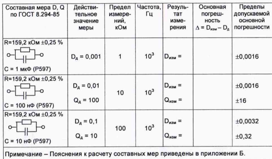
Таблица А.4 – Определение основной погрешности прибора при измерении величин D, Q