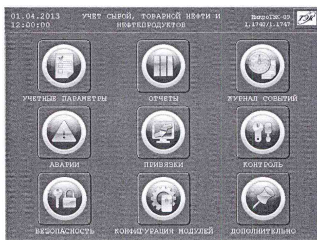
Рисунок 1 – Идентификационные данные ПО

8.5.1.2 Проверку идентификационного наименования и номера версии ПО ИВК проводят сравнением данных, приведённых в 8.5.1.1 настоящей МП и отображаемых в верхнем правом углу главного окна дисплея ИВК (рисунок 1).