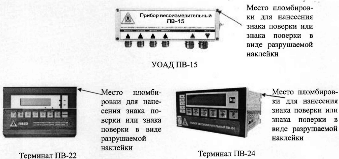
Рисунок 1 - Схема пломбировки от несанкционированного доступа

7.3 При отрицательных результатах поверки в установленном порядке оформить извещение о непригодности с указанием причин, а весы к применению не допускают. Свидетельство о предыдущей поверке аннулируют.