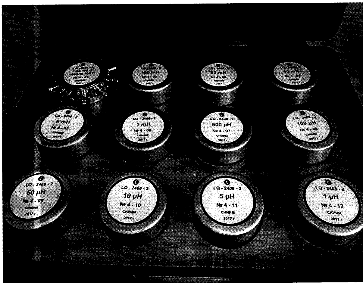
Рисунок 1 - Внешний вид набора рабочих эталонов

Внешний вид набора рабочих эталонов индуктивности и добротности LQ-2408 представлен на рисунке 1.