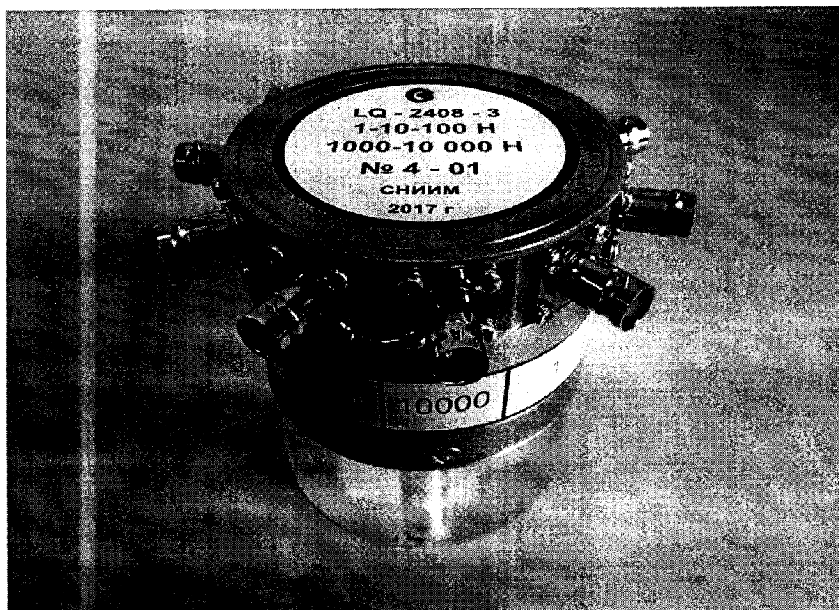
Рисунок 3 - Общий вид эталона LQ-2408-3