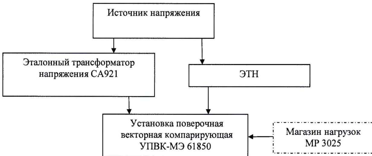
Рисунок 1 – Структурная схема проверки класса точности по ГОСТ Р МЭК 60044-7-2010 (с номинальным вторичным напряжением переменного тока 100/\sqrt{3} ) и класса точности по ГОСТ Р МЭК 60044-7-2010 (протокол IEC 61850-9-2)