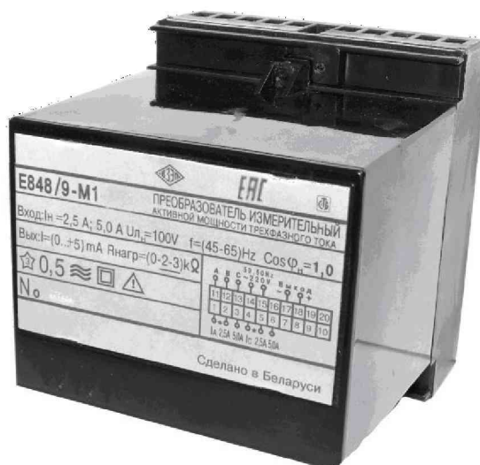
Рисунок 1 – Внешний вид ИП

Фотография общего вида ИП приведена на рисунке 1, схема пломбировки от несанкционированного доступа, с указанием места для нанесения оттиска клейма ОТК и места нанесения знака поверки на ИП приведены на рисунке 2.