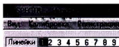
Рисунок 1б. Окно с идентификационным названием ПО Spectr и уровнем доступа.