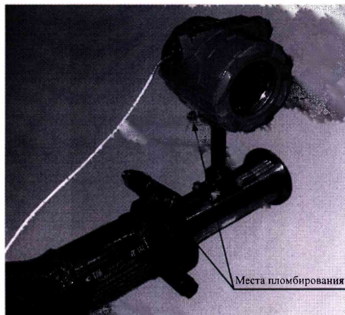
Рисунок А.2 – Схема пломбировки от несанкционированного доступа и обозначение места нанесения знака поверки расходомеров-счетчиков