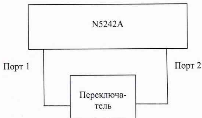
Рисунок 1 – Схема подключения при определении начального ослабления и КСВН входа переключателя

7.3.1.2 Провести калибровку анализатора цепей векторного с СВЧ кабелем в диапазоне частот до 26,5 ГГц согласно РЭ анализатора.