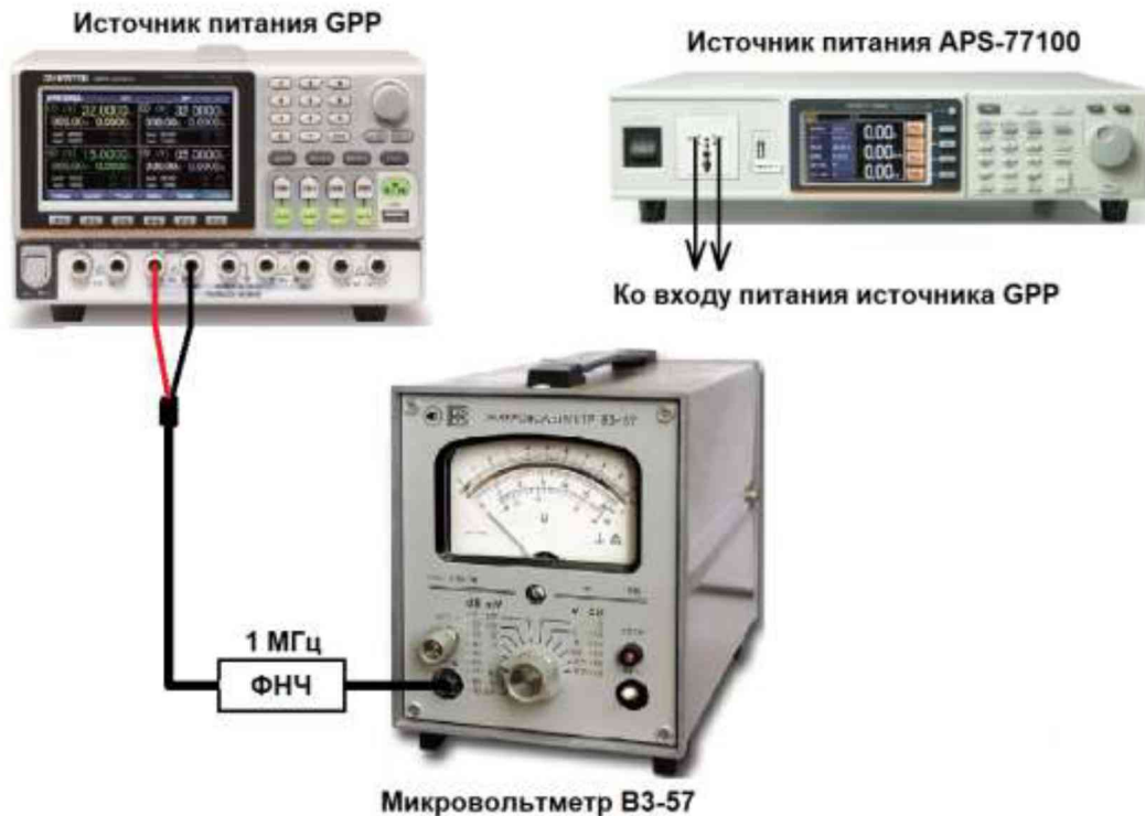
Рисунок 4 – Структурная схема соединения приборов для определения уровня пульсаций выходного напряжения источников

7.7.2 На поверяемом источнике при помощи поворотных регуляторов и/или функциональных клавиш установить максимальное значение напряжения и значение силы постоянного тока на выходе.