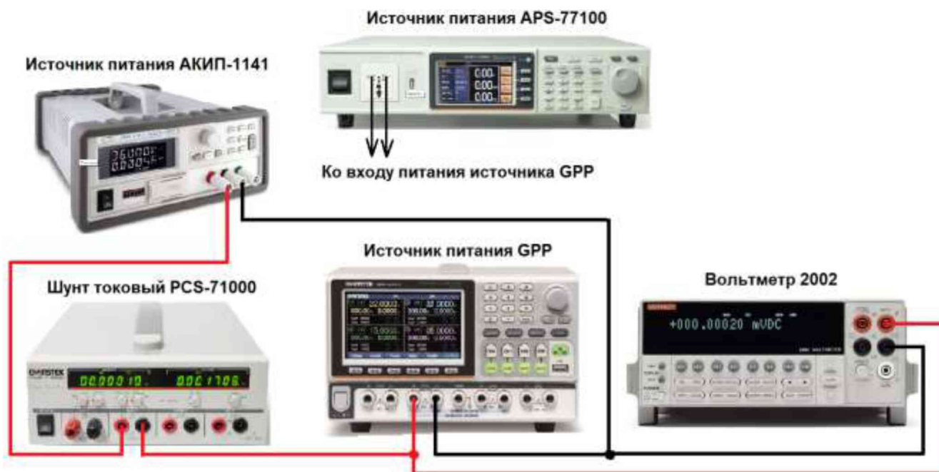
Рисунок 7 – Структурная схема соединения приборов для измерения параметров в режиме электронной нагрузки

7.11.2 Перевести канал 1 (СН1) поверяемого источника (далее – нагрузки) в режим электронной нагрузки, согласно руководства по эксплуатации. Установить режим стабилизации постоянного тока (СС).