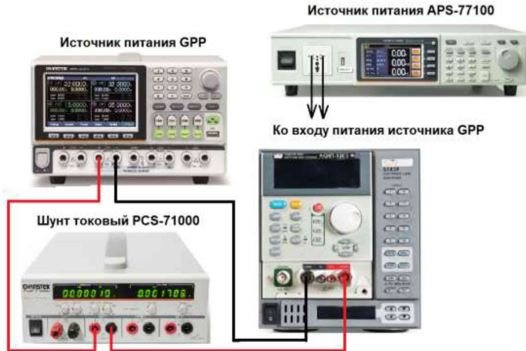
Рисунок 6 – Структурная схема соединения приборов для определения нестабильности силы тока на выходе источников

7.9.1 Разъемы канала 1 (CH1) поверяемого источника соединить при помощи измерительных проводов с соответствующими разъемами нагрузки электронной АКИП-1303, шунта токового PCS-71000 в соответствии с рисунком 6.