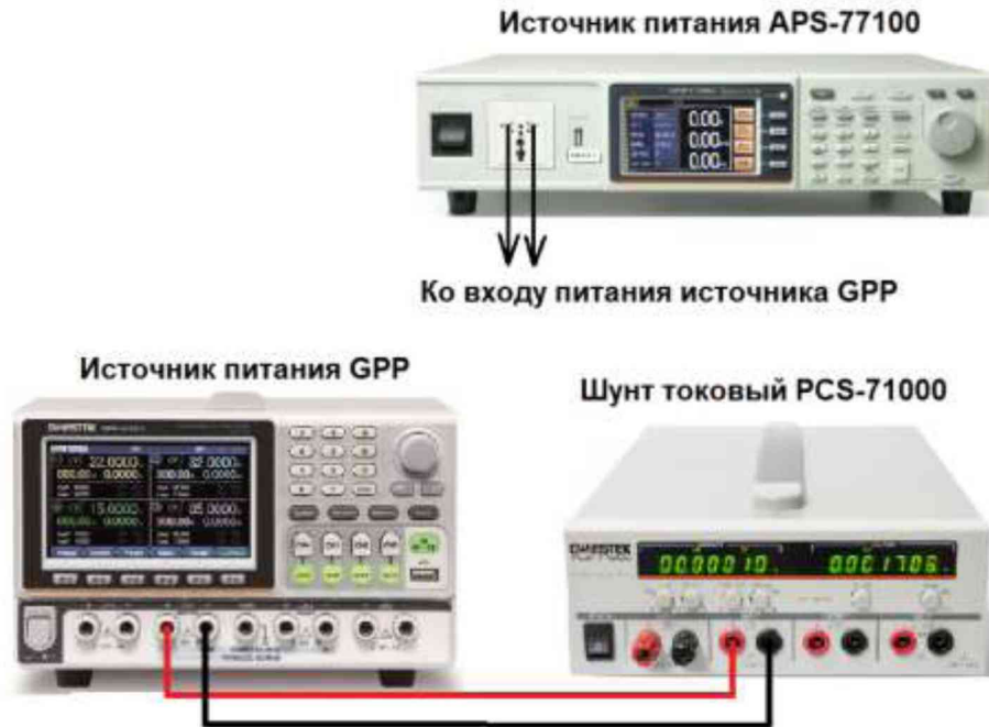
Рисунок 5 – Структурная схема соединения приборов для определения погрешности установки/измерения силы постоянного тока на выходе источников

7.8.3 Органами управления поверяемого источника установить максимальное напряжение на выходе, значение силы тока на выходе установить равным 10 % от максимального значения выходного диапазона.