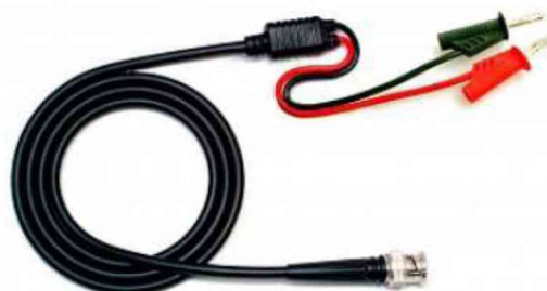
Рисунок 3 – Измерительный кабель для определения уровня пульсаций напряжения

7.7.1 При помощи соединительного провода BNC-штекер «банан» (рисунок 3) подключить канал 1 (СН1) источника к микровольтметру ВЗ-57 через фильтр низких частот 1 МГц, согласно рисунку 4. На источнике питания APS-77100 установить напряжение, равное номинальному (230 В), контролируя его при помощи встроенного вольтметра.