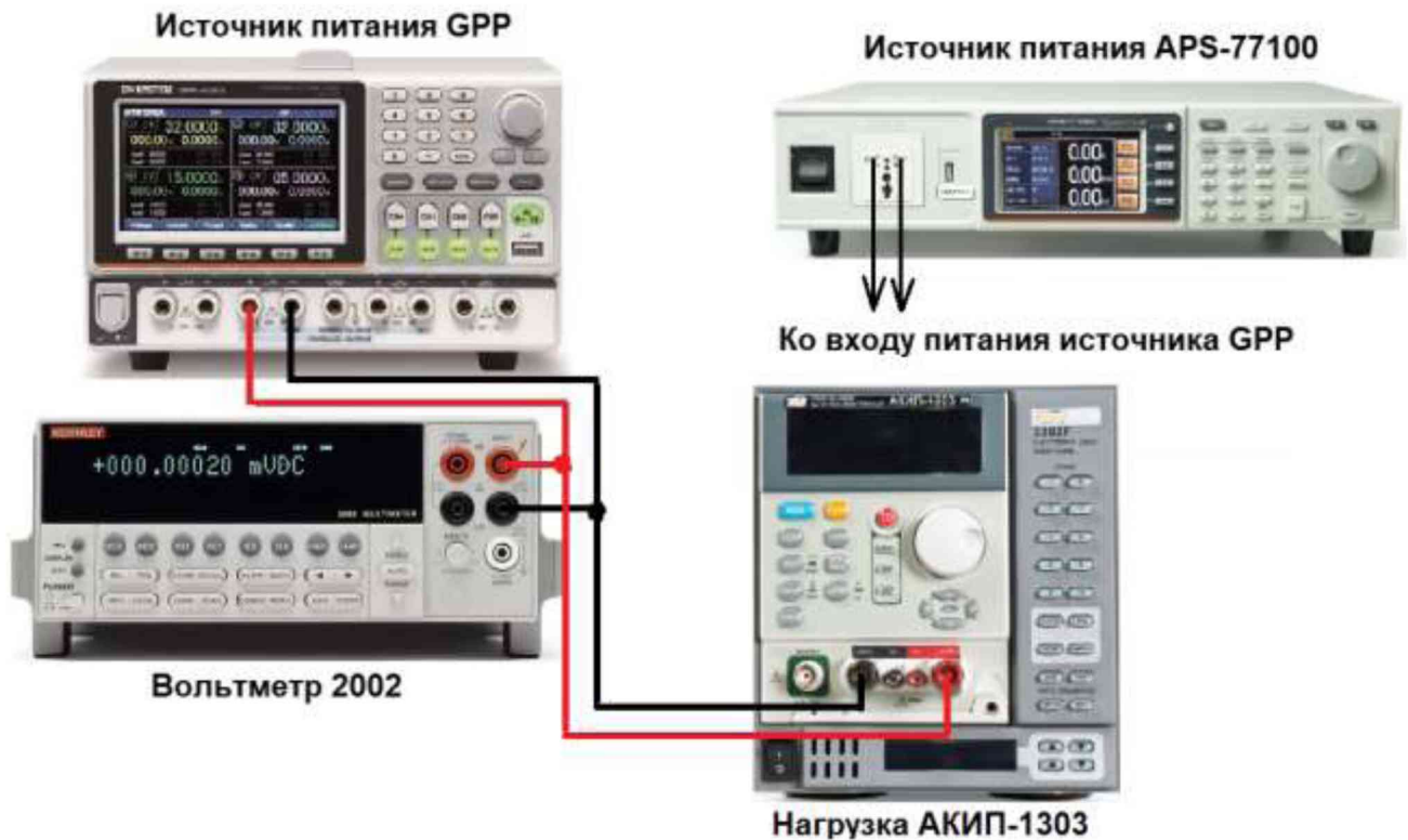
Рисунок 2 – Структурная схема соединения приборов для определения нестабильности выходного напряжения источников

7.5.2 Перевести вольтметр 2002 в режим измерения напряжения постоянного тока, включить функцию «FILTER» для усреднения показаний.