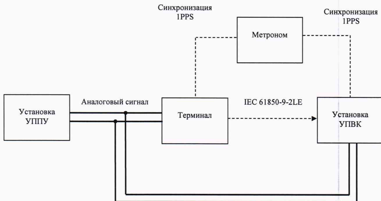
Рисунок А.1 – Структурная схема определения основных приведенных к номинальному значению погрешностей преобразований среднеквадратических значений напряжения переменного тока