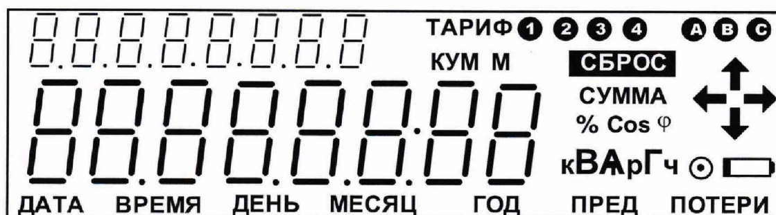
Рисунок 1 – Внешний вид ЖКИ

6.3.5 Последовательно нажимая кнопки управления счетчика (счетчики «Меркурий 204», «Mercury 204», «Меркурий 234», «Mercury 234») убедиться, что после каждого нажатия кнопки происходит изменение информации на ЖКИ.