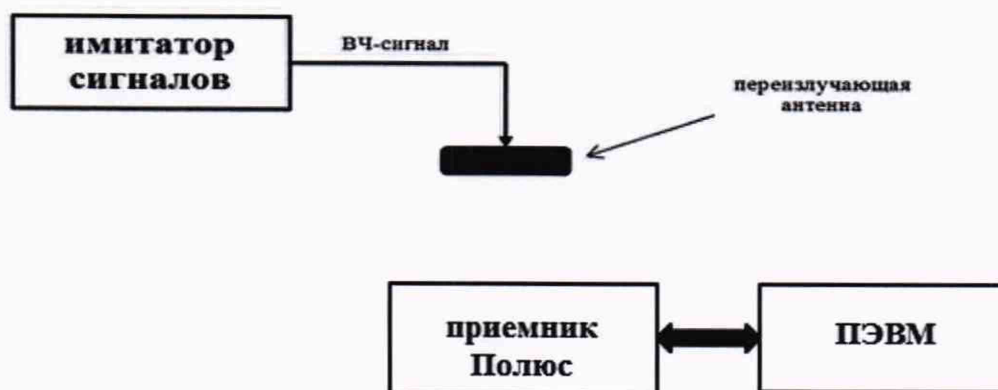
Рисунок 1 - Схема для проведения измерений при проверке работоспособности и определения инструментальной погрешностей определения координат местоположения в плане

8.2.2 На имитаторе сигналов воспроизвести сценарий, параметры которого указаны в Таблице 4.