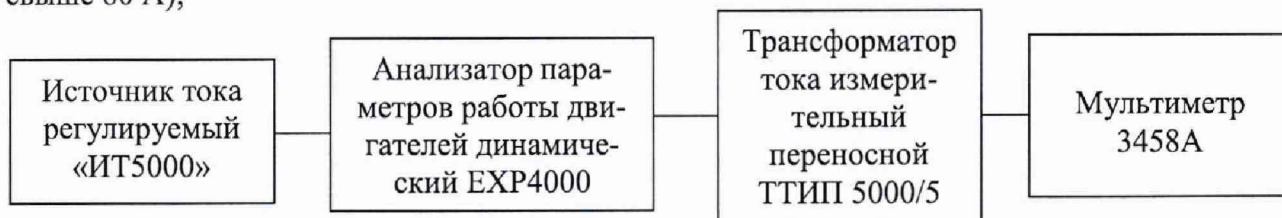
Рисунок 2 – Схема подключений для определения погрешности измерений среднеквадратического значения силы переменного тока свыше 80 А

1) собрать схему согласно рисунку 1 (для определения погрешности измерений среднеквадратического значения силы переменного тока до 80 А) или рисунку 2 (для определения погрешности измерений среднеквадратического значения силы переменного тока свыше 80 А);