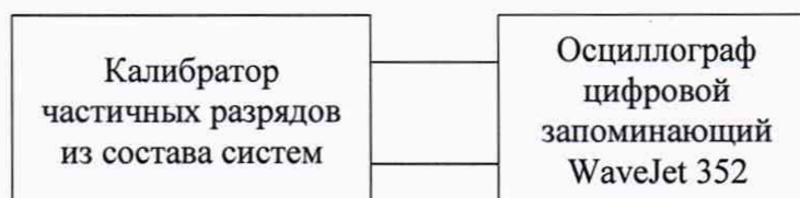
Рисунок А.3 - Схема структурная определения приведенной к диапазону воспроизведений погрешности воспроизведений кажущегося заряда (при использовании калибратора частичных разрядов из состава систем)