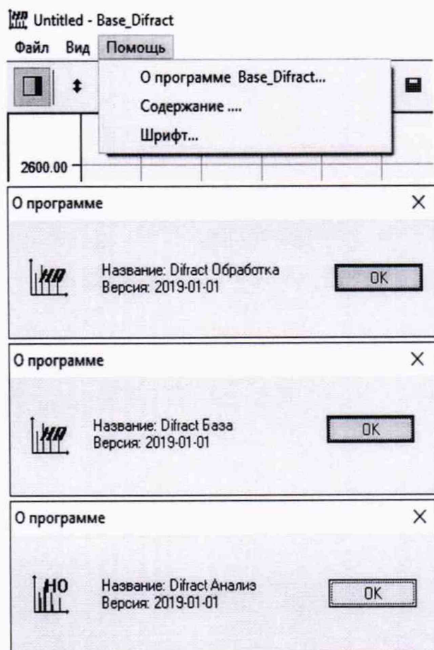
Рисунок 1. Окна с идентификационным наименованием и номером версии ПО Difract.

В главном меню окна каждого модуля ПО Difract (Difract Съемка, Difract Обработка, Difract База, Difract Анализ) открыть раздел «Помощь» (Help), в раскрывающемся списке выбрать подменю «О программе». В открывшемся окне приведены наименования модулей ПО Difract (Difract Съемка, Difract Обработка, Difract База, Difract Анализ), номер версии соответствующего модуля ПО Difract. Примеры окон идентификации наименования и номера версии пмодулей ПО Difract приведены на рисунке 1.