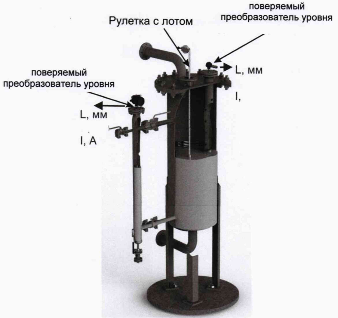
Рисунок 2 – Проверка преобразователя уровня без демонтажа с помощью эталонной рулетки с лотом