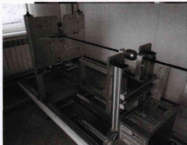
Рисунок 1 – Поверка преобразователя уровня на поверочной установке а) с непосредственным изменением уровня жидкости б) с имитацией изменения уровня жидкости