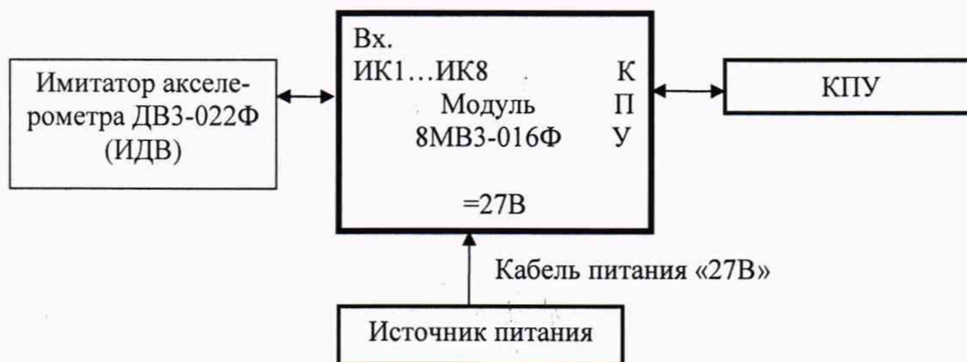
Рисунок 1 - Схема опробования

7.2.1.2 Все приборы при этом должны быть выключены. Модуль должен находиться в выключенном состоянии (тумблер «ВКЛ» - в нижнем положении).