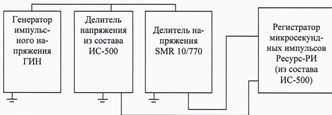
Рисунок 1 - Схема проверки относительной погрешности коэффициентов масштабного преобразования до 250 кВ