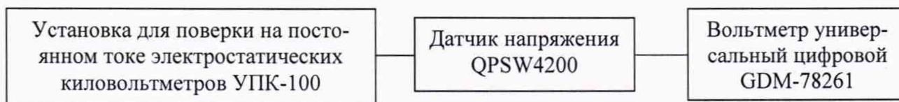
Рисунок 1 - Схема подключения для опробования и определения метрологических характеристик

2) подготовить к работе установку для поверки на постоянном токе электростатических киловольтметров УПК-100 (далее - УПК-100) и вольтметр универсальный цифровой GDM-78261 (далее – вольтметр) согласно их эксплуатационной документации;