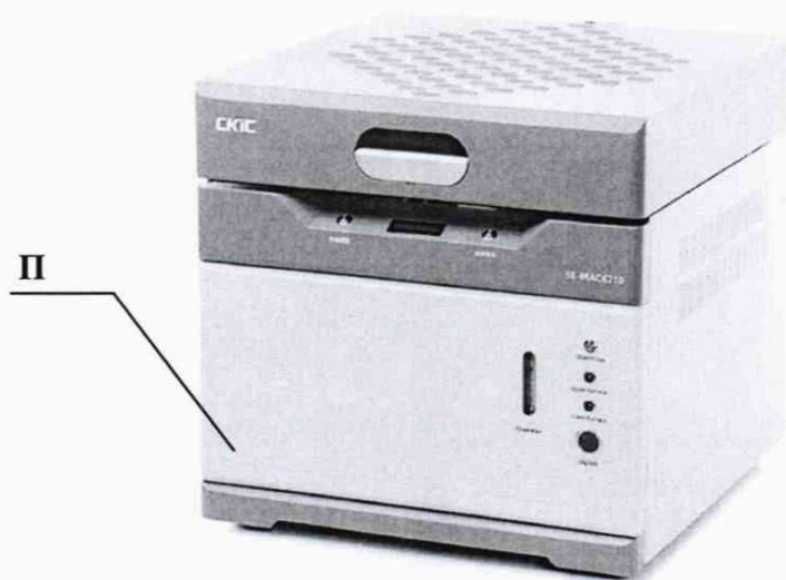
Рисунок 1 – Общий вид анализатора термогравиметрического SKIC серии 5E-MAC (идентичен для двух вариантов исполнения, позиция «П» обозначает место нанесения знака поверки)

Общий вид анализаторов и место нанесения знака поверки представлены на рис. 1. Пломбирование анализаторов не предусмотрено.