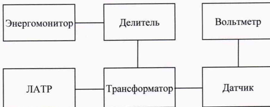
Рисунок 3 – Структурная схема определения основной относительной погрешности коэффициента масштабного преобразования

3) При помощи ЛАТРа и трансформатора поочередно воспроизвести испытательные сигналы напряжения переменного тока согласно таблице 4.