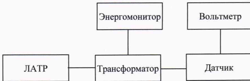
Рисунок 2 – Структурная схема определения основной относительной погрешности коэффициента масштабного преобразования

2) Собрать схему, представленную на рисунке 2 (для испытательного сигнала напряжения переменного тока 500 В) или 3 (для испытательных сигналов напряжения переменного тока 3500, 6500, 9500 и 13000 В).