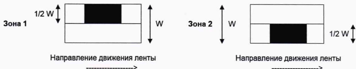
Рисунок 1 — Расположение испытательных нагрузок при оценке погрешности в режиме динамического взвешивания объектов измерений при их нецентрированном положении при движении по конвейерной ленте