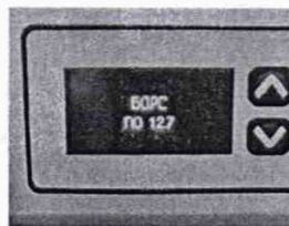
Рисунок 1 – Окно с названием и номером версии ПО

6.3.1.2. Белизномер считается прошедшим поверку по п. 6.3, если номер версии 1.2.5 или выше.