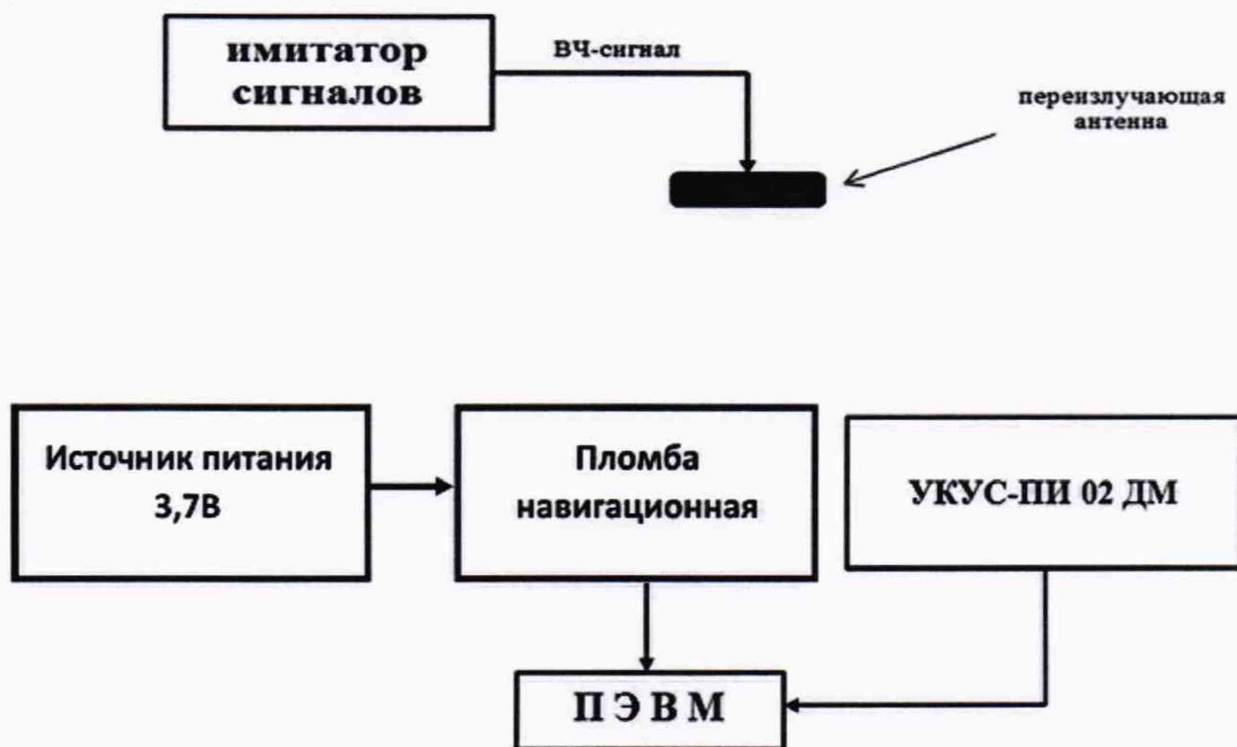
Рисунок 4 – Схема проведения измерений при периодической поверке устройств

8.3.2.1 Собрать схему в соответствии с рисунком 4 (допускается передача данных с устройства по каналам беспроводной связи GSM/GPRS, допускается питание устройства от встроенной батареи аккумулятора).