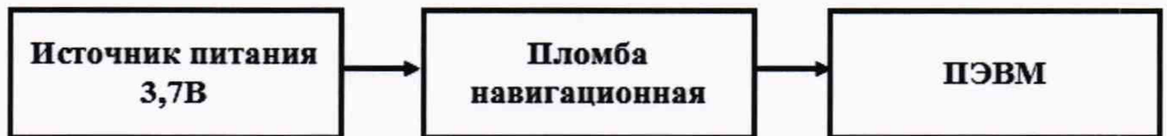
Рисунок 2 – Схема опробования и проведения измерений при периодической проверке устройств

8.2.2.1 Собрать схему в соответствии с рисунком 2.