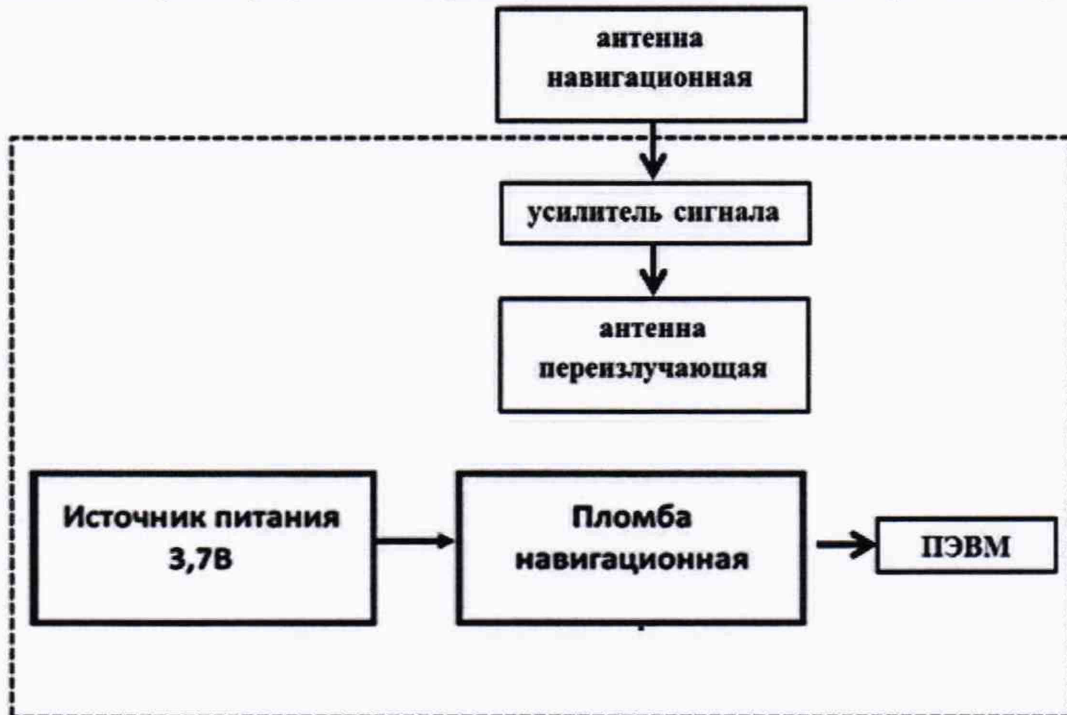
Рисунок 5 – Схема проведения измерений при определении погрешности определения координат при первичной поверке

8.5.1 Собрать схему в соответствии с рисунком 5 (допускается питание устройства от встроенной батареи аккумуляторной). Установить антенну навигационную на пункт геодезический. Настроить устройства на работу по сигналам ГЛОНАСС (L1, код СТ).