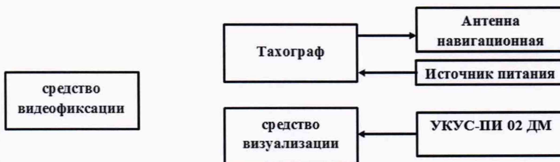
Рисунок 5 - Схема проведения измерений при определении абсолютной погрешности синхронизации шкалы времени внутреннего опорного генератора тахографа со шкалой времени блока СКЗИ

8.10.1 Собрать схему в соответствии с рисунком 5. Средство визуализации должно иметь разрешающую способность индикации оцифровки метки времени не менее 0,1 с.