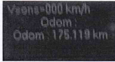
Рисунок 4 – Диалоговое окно 2 тахографа

8.8.3 Выполнить действия п. 8.8.2 не менее трех раз.