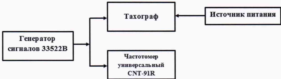
Рисунок 2 – Схема проведения измерений при определении погрешности измерения интервала времени и инструментальной погрешности пройденного пути

8.3.1 Собрать схему в соответствии с рисунком 2.