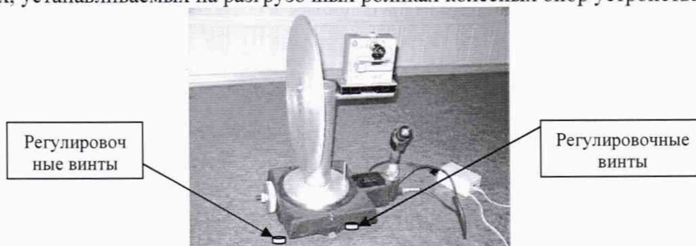
Рисунок 1 - Установка угломерная на основе столов поворотных СТ-9

7.4.1.1 Проверку диапазона измерений углов развала колес проводить с помощью квадранта оптического, путем последовательной попарной установки (соответственно на местах размещения передней и задней осей автомобиля) установок угломерных на основе столов поворотных СТ-9 (далее - установки угломерные). Установки угломерные (Рис. 1) размещаются на площадках, устанавливаемых на разгрузочных роликах колесных опор устройства.