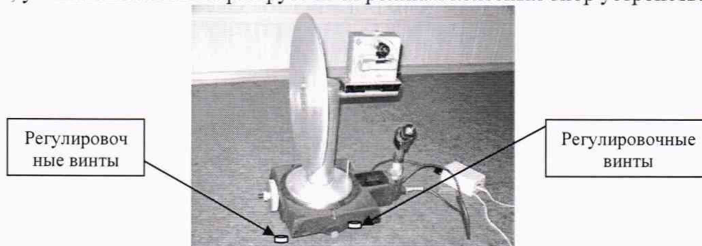
Рисунок 1 - Установка угломерная на основе столов поворотных СТ-9

7.4.1.1 Проверку диапазона измерений углов развала колес проводить с помощью квадранта оптического, путем последовательной попарной установки (соответственно на местах размещения передней и задней осей автомобиля) установок угломерных на основе столов поворотных СТ-9 (далее - установки угломерные). Установки угломерные (Рис. 1) размещаются на площадках, устанавливаемых на разгрузочных роликах колесных опор устройства.