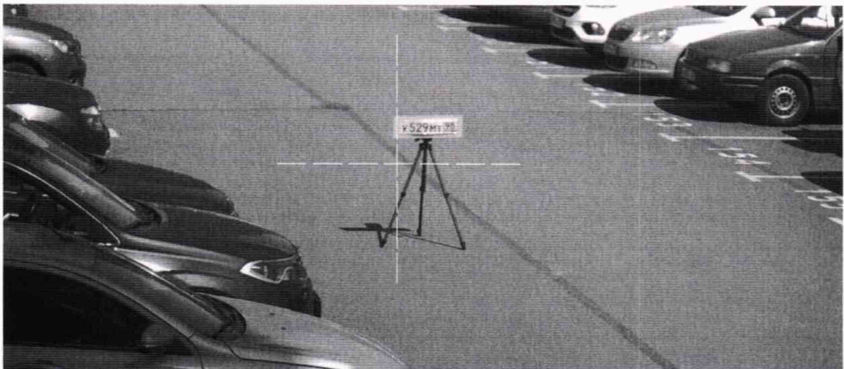
Рисунок 3б – Ориентация комплекса при периодической проверке на месте установки

7.5.4 Помещая номерной знак в точки 2-5 для видеодатчиков «Кросс»К и в точки 2-4 для видеодатчиков «Кросс»Д, зафиксировать не менее пяти результатов измерения углов \alpha_{\text{ИЗМ}} для каждой точки.