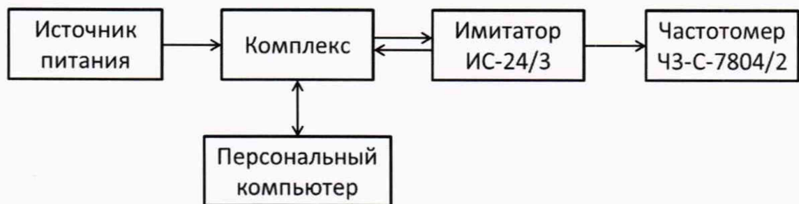
Рисунок 4 – Схема для определения погрешности измерения скорости ТС и рабочей частоты излучения

7.7.2 Установить комплекс перед имитатором скорости движения транспортных средств «ИС-24/3», включить режим имитации одиночной цели имитатора при дальности 50 м. При поверке комплекса на месте эксплуатации установить имитатор скорости «ИС-24»Д на расстоянии от 20 до 30 м от видеодатчика.