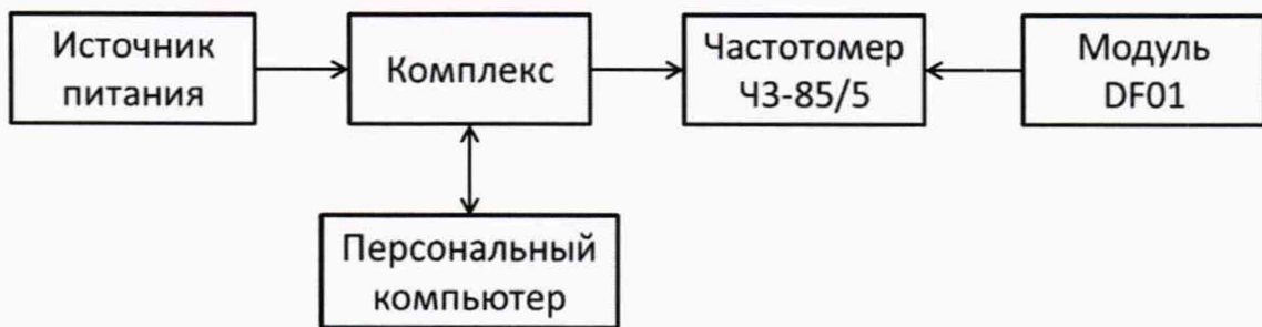
Рисунок 1 – Схема проведения измерений при определении погрешности синхронизации шкалы времени комплекса

7.3.1 Собрать схему в соответствии с рисунком 1. Подключить выход 1PPS источника точного времени к входу первого канала частотомера. Подключить выход 1PPS блока обработки информации (далее – БОИ) испытуемого комплекса к входу второго канала частотомера кабелем, входящим в комплект поставки.