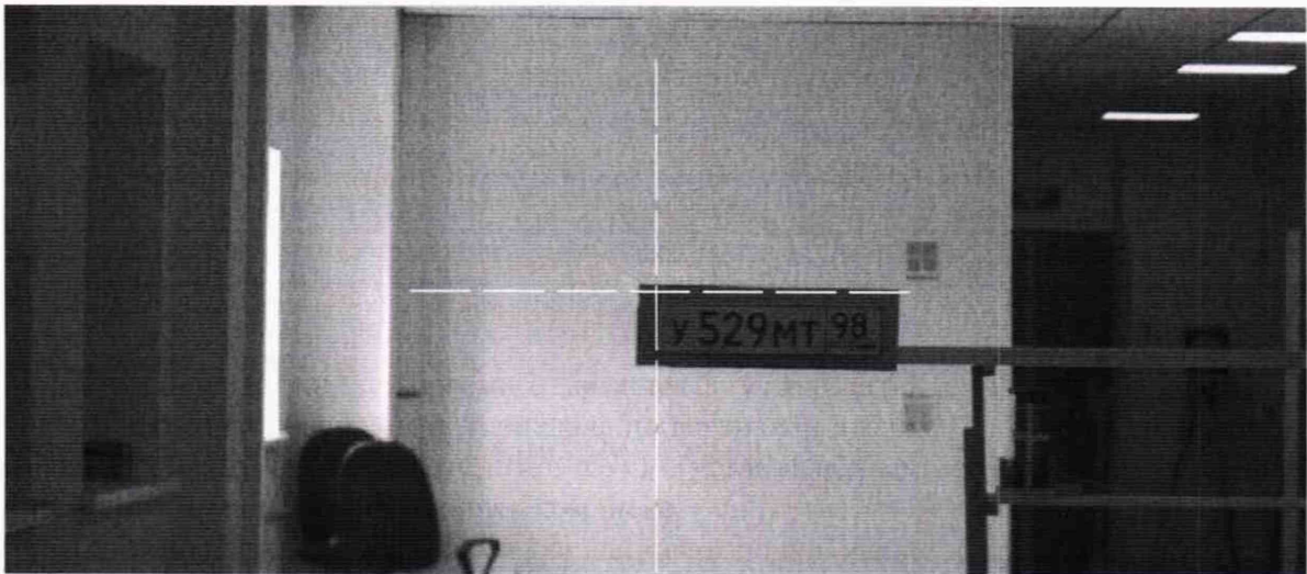
Рисунок 3а – Ориентация комплекса при первичной проверке

7.5.3 Направить комплекс на точку 2 так, чтобы метка на экране персонального компьютера (рисунок 3) оказалась на левом краю изображения номерного знака.