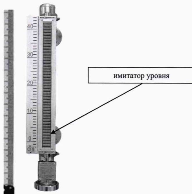
Рисунок 2 - Проверка уровнемера с имитацией изменения уровня

5.2 При периодической поверке без демонтажа